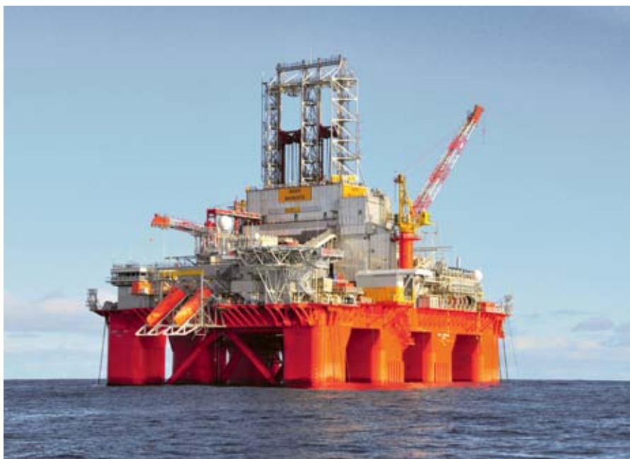
Aker Barents.

I tillegg til boringen på PL 450 i Nordsjøen, vil North Energy ta del i ytterligere tre operasjoner. På PL 370, hvor Wintershall er operatør, er det ventet boring mot slutten av første, eller i begynnelsen av andre