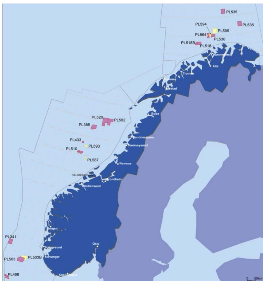
North Energys lisenser. Nye tildelinger i for forhåndsdefinerte områder (TFO 2010) i gult.

North Energy vil fortsette å vurdere høykvalitets kjøpsmuligheter og nedsalg, samt bytter vil også bli vurdert for å balansere risiko og finansiell eksponering av porteføljen.